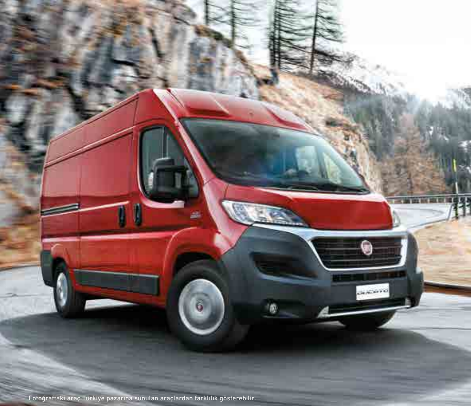
Fotoğraftaki araç Türkiye pazarına sunulan araçlardan farklılık gösterebilir.

Yeni Ducato daima maksimum güvenlik ve performansla sürüş anlamına gelir. En ileri kontrol ve güvenlik teknolojisiyle donatılmıştır.