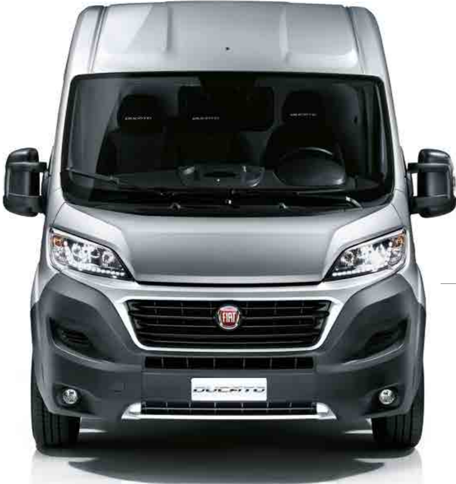
DÖRT PARÇADAN OLUŞAN ÖN KISIM

koyuyor. Stil kavramının Yeni Ducato'nun olmazsa olmazlarından olduğunu anlamak için tamponlarına, ızgarasına ve ön farlarına bir bakış atmak yeterli.