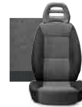
157 KREP GRİ